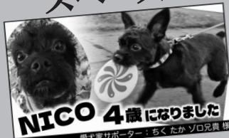
※愛犬自慢掲載イメージ